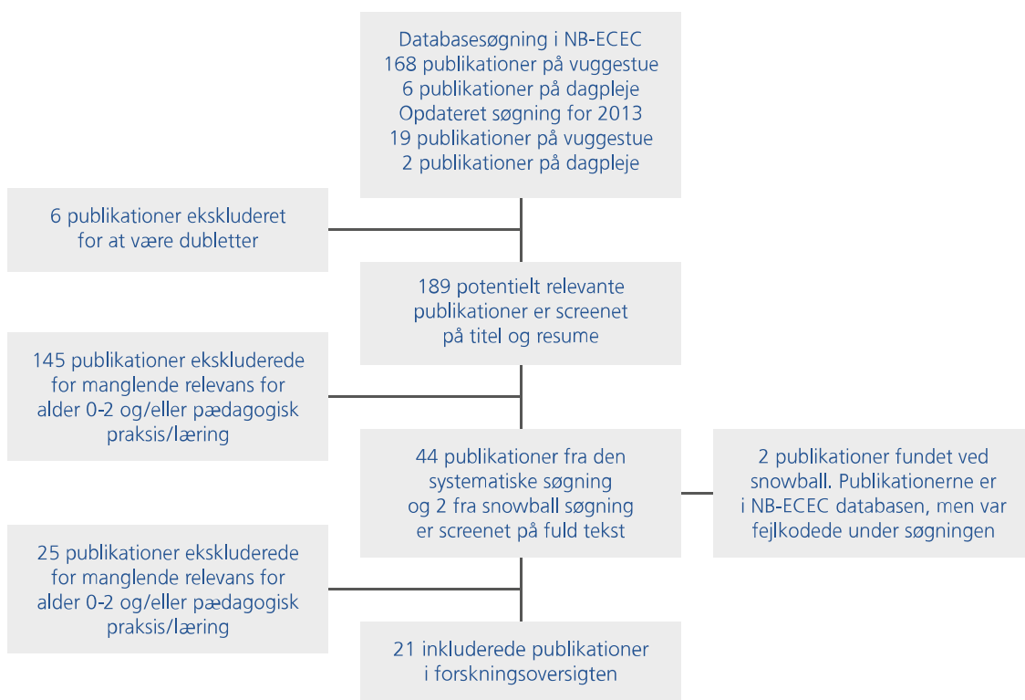
Figur 1 Flowchart over screeningsproces

Aldersgruppen for nogle af de inkluderede publikationer er angivet som op til 3 år. Det kan skyldes forskellige regler for, hvornår små børn overgår fra småbørnspasning til børnehave i de forskellige lande, og om man regner meget skarpt med et skifte ved 3-årsalderen.